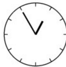
Vijf voor een