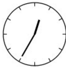
Vijf over half een