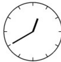
Tien over half een