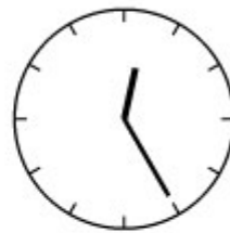
Vijf voor half een