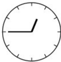
Kwart voor een