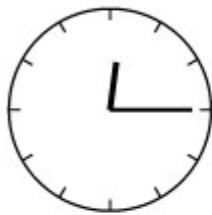
Kwart over twaalf